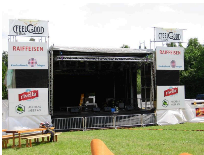
Abgebildetes Bild mit Symbolcharakter

Der Preis dafür: CHF 3'000.00 (zzgl. MWST) , also CHF 1.00 pro anwesende Person.